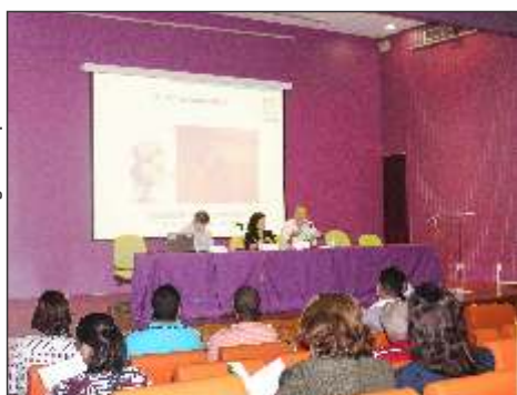
Diretoria Colegiada da FioSaúde apresenta o Relatório Anual da Caixa de Assistência em Assembleia para beneficiários titulares do plano.