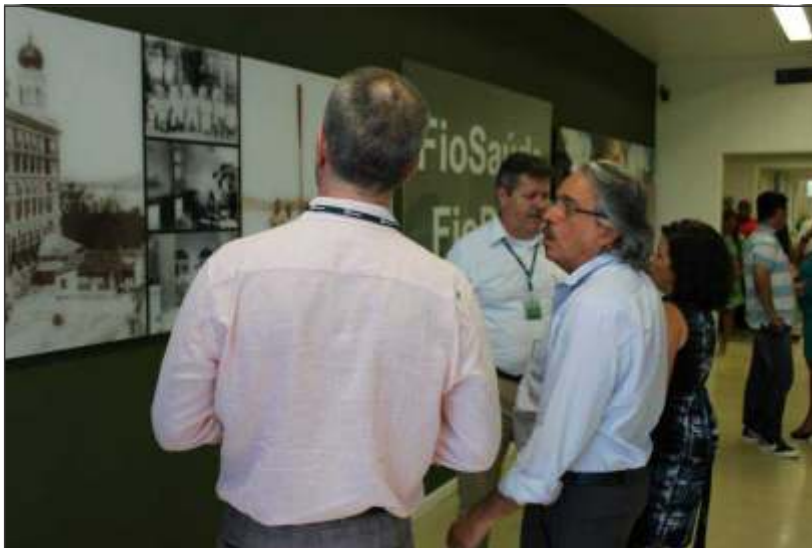
Presidência da Fiocruz e Diretoria da FioSaúde na inauguração da ampliação da Policlínica, em 04 de dezembro