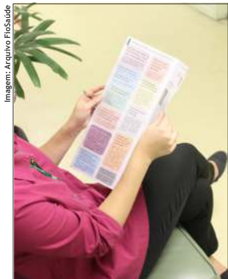
Orientações disponíveis na recepção da Policlínica.

Confira abaixo algumas dicas divulgadas: