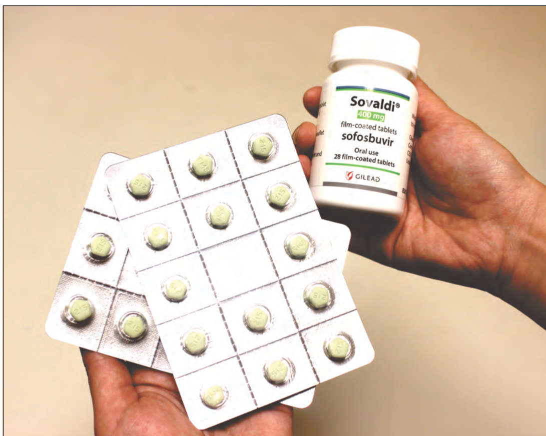
Imagens meramente ilustrativas.

Quem sofre de complicações da hepatite C pode contar com novos medicamentos gratuitamente fornecidos pelo governo