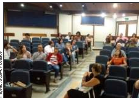
Encontro com beneficiários em Salvador.

Com objetivo de ouvir os beneficiários da Caixa de Assistência e suas sugestões sobre o plano, a Diretoria da FioSaúde visitou, entre os dias 26/4 e 26 de maio, unidades da Fiocruz fora do Rio de Janeiro: Recife, Bahia, Belo Horizonte, Brasília e Manaus.