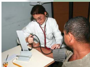
Endocrinologia é especialidade oferecida a partir de 2007