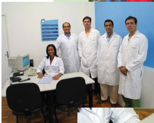
Na primeira expansão física, Cardiologia e Ortopedia