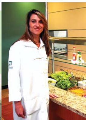
Geriatria está na Policlínica desde 2005