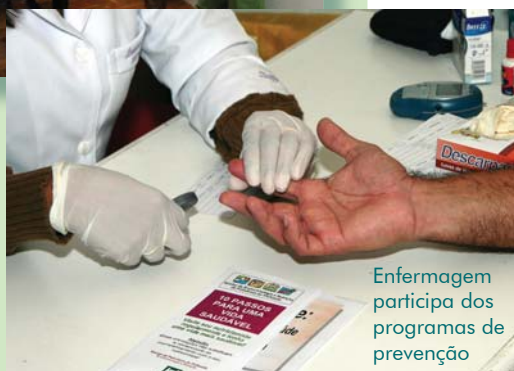
Enfermagem participa dos programas de prevenção

ternados não contavam com o mesmo tipo de atendimento. A visitação veio então com o objetivo de estender o cuidado médico desempenhado nos consultórios da Policlínica às internações. Ao mesmo tempo, o programa cria um vínculo com pacientes e suas famílias. Os casos de usuários internados que não contam com médicos assistentes na internação são assumidos pelos médicos especialistas do programa de visitação hospitalar.