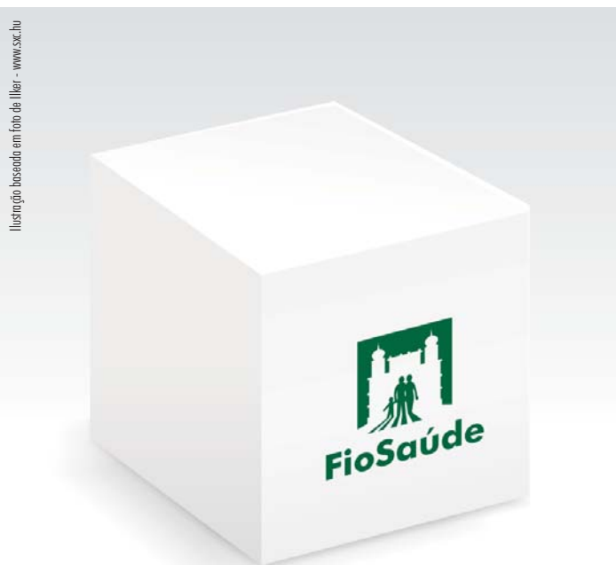
Ilustração baseada em foto de Illet - www.sx.chu

Dentro do planejamento para a entrada em funcionamento da Caixa de Assistência, as