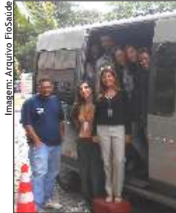
Caravana de doadores em 24/6

A ação solidária fez parte do calendário de campanhas de promoção da saúde.