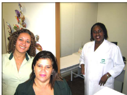
Marcação de consultas e atendimento em enfermagem no novo espaço inaugurado na Policlínica