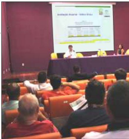
FioSaúde realiza assembleia em 16 de dezembro

No dia 16 de dezembro, no Auditório do Museu da Vida - Manguinhos/Fiocruz, aconteceu a segunda Assembleia-Geral Ordinária da Caixa de Assistência de 2014, na qual foi apresentada aos beneficiários a proposta de nova tabela para o plano de saúde, a ser implantada a partir de janeiro de 2015.