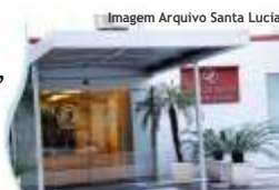
Imagem Arquivo Santa Lucia

R. Capitão Salomão, 27 - Botafogo - RJ - Tel.: 2126-4000