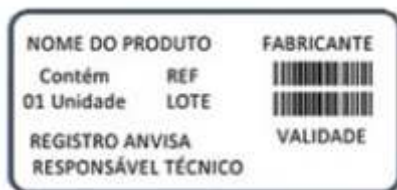
Modelo de etiqueta de rastreabilidade para dispositivos médicos implantáveis, acessível para o paciente

É importante destacar que o paciente deve buscar com o médico assistente informações sobre a agenda de revisão com previsão de retorno para novas consultas de avaliação pós-cirúrgicas (em curto, médio e longo prazo).