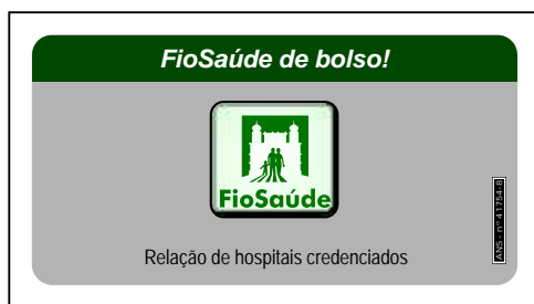
FioSaúde de Bolso traz comodidade nas emergências

Com isso, a Caixa de Assistência preparou um folheto destinado a titulares que residem no Rio de Janeiro, Belo Horizonte, Brasília, Curitiba, Manaus, Recife e Salvador. É o FioSaúde