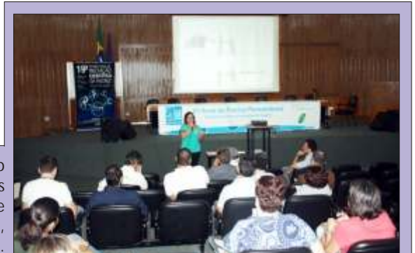
Registro fotográfico da visita dos Diretores do FioSaúde ao C.P.q A.M., em Recife, no dia 26 de outubro.